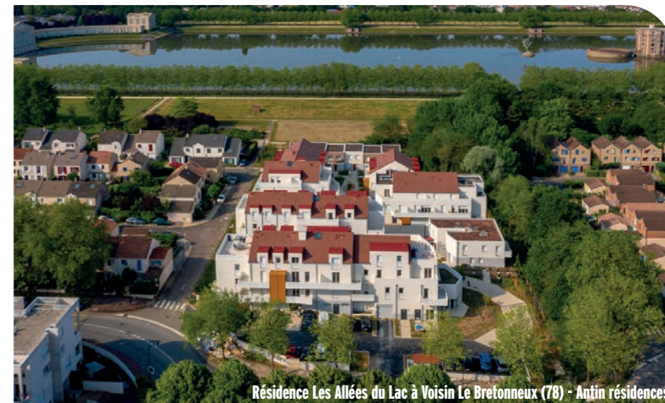
Résidence Les Allées du Lac à Voisin Le Bretonneux (78) - Antin résidences