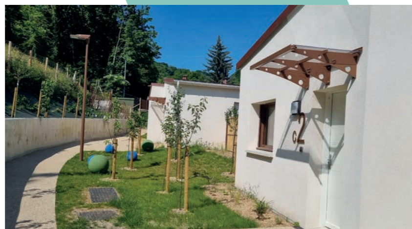
Résidence Simone Veil à Amfreville-la-Mivoie (76) – LE FOYER STEPHANAIS

Le label Mon Logement Santé vise à garantir aux habitants, pour tous les moments de la vie, un habitat qui agisse de manière positive sur leur santé. Il se réalise de manière opérationnelle à travers 3 thématiques d'engagements :