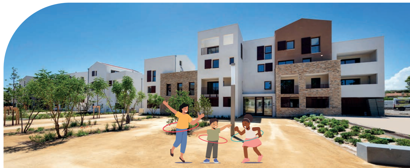
Résidence Cœur d'Oc à Saint Georges d'Orques (34) – SFHE

Demain, un référentiel d'engagement Mon Logement Santé s'appliquera aussi pour la réhabilitation du parc existant.